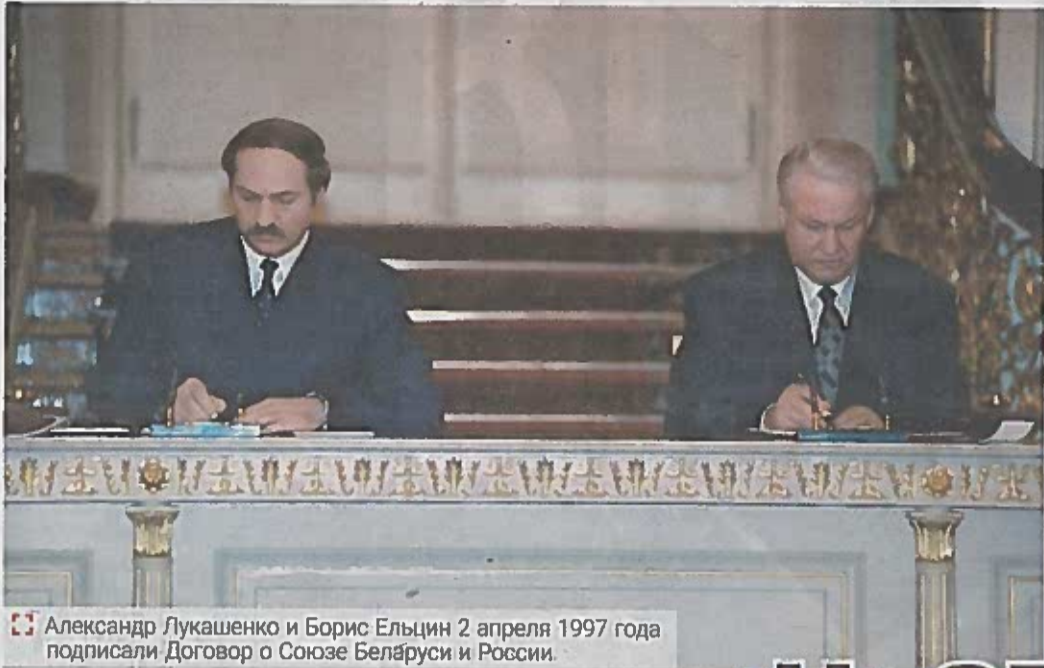
Александр Лукашенко и Борис Ельцин 2 апреля 1997 года подписали Договор о Союзе Беларуси и России.