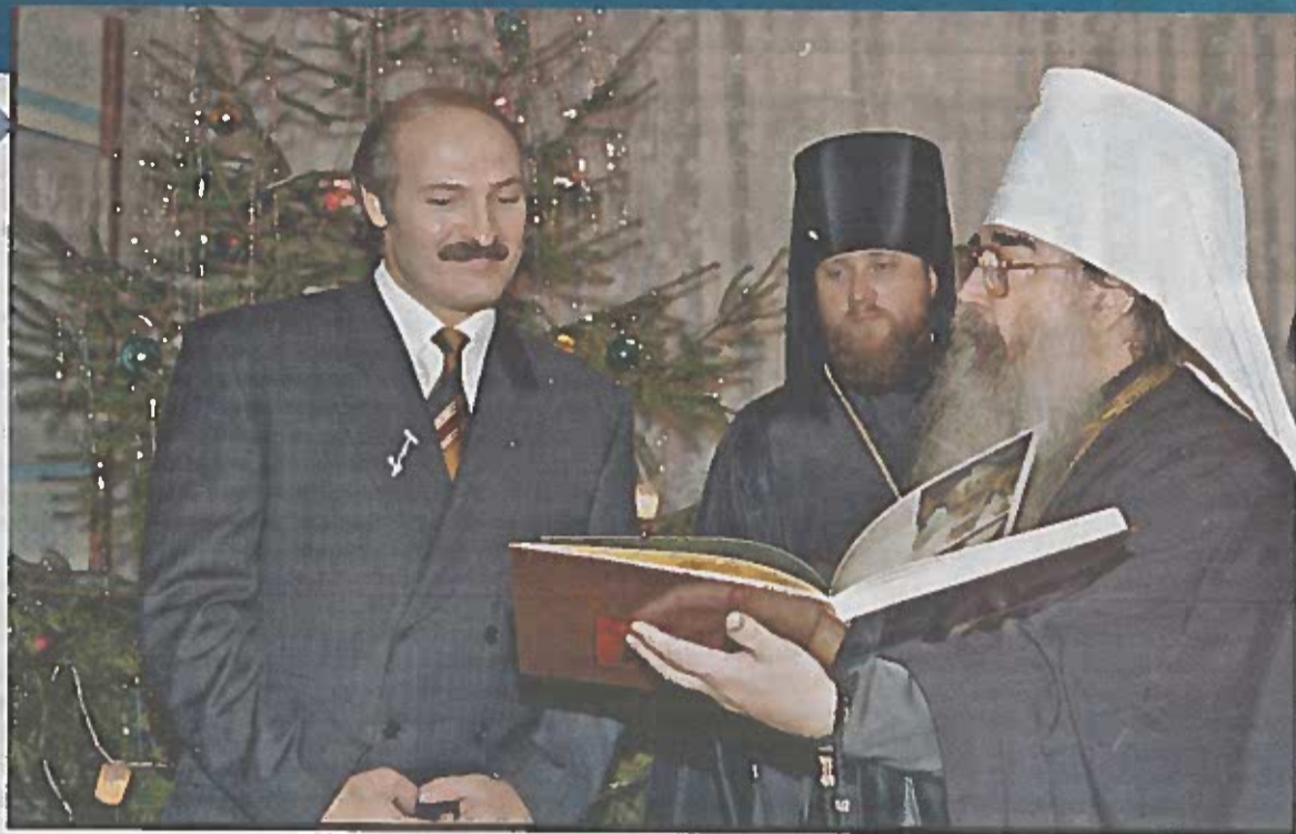
Президент Беларуси Александр Лукашенко 7 января 1997 года принял участие в рождественском богослужении в Свято-Духовом кафедральном соборе Минска. Следуя христианским традициям, в этот светлый праздник, являющийся одним из наиболее важных для православных верующих, Глава государства присутствовал в храме и зажег рождественскую свечу.

На совместном заседании Палаты представителей и Совета Республики («СБ», 11 октября 1997 года).