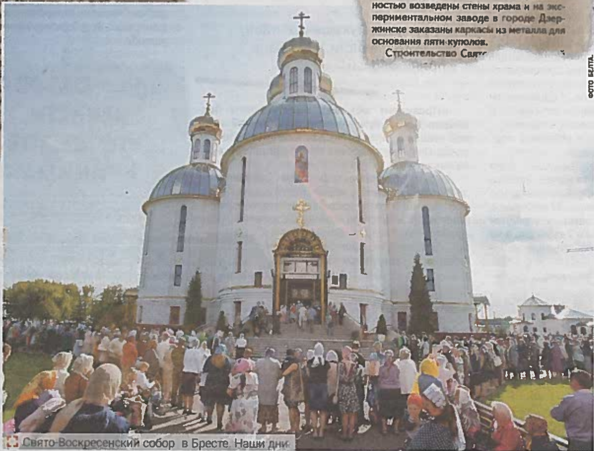
Свято-Воскресенский собор в Бресте. Наши дни.