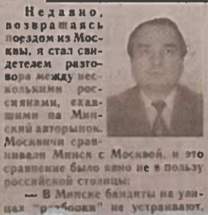
— В Минске бандиты на улицах «пробочка» не устраивают.

рынке под своим контролем. Благодаря совместным усилиям в последние время мы разоблачили несколько преступных групп, занимавшихся кражами автомобилей, подделкой документов на похищенный автотранспорт. В этом бизнесе задействованы сотни людей, и тут можно говорить об организованной преступности. Ее признаки просматриваются и в действиях различных группировок, занимающихся нелегальным квартирным бизнесом, торговлей наркотиками, оружием, «живым товаром». Но хочу уточнить, что милиция предпринимает все меры, чтобы