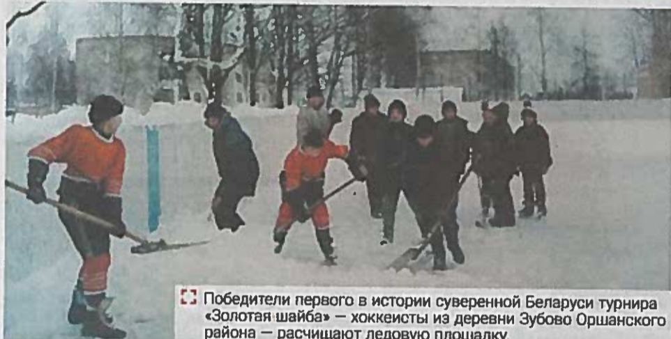
Победители первого в истории суверенной Беларуси турнира «Золотая шайба» — хоккеисты из деревни Зубово Оршанского района — расчищают ледовую площадку.