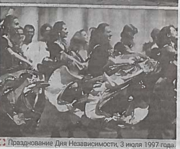
Празднование Дня Независимости, 3 июля 1997 года.