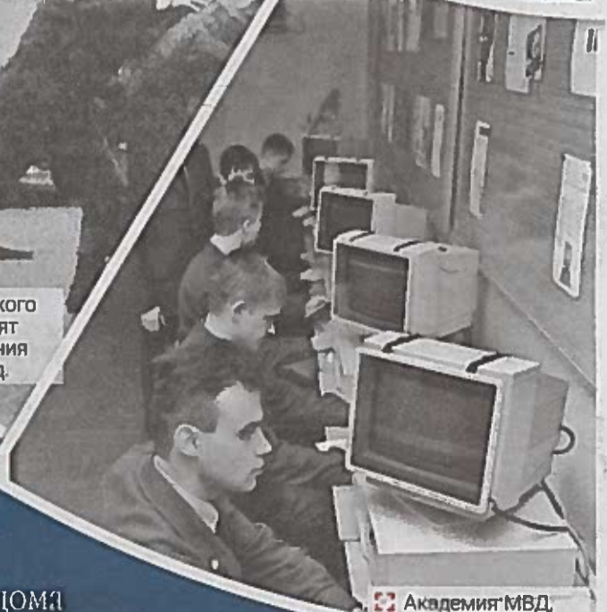
Академия МВД, апрель 1997 года.