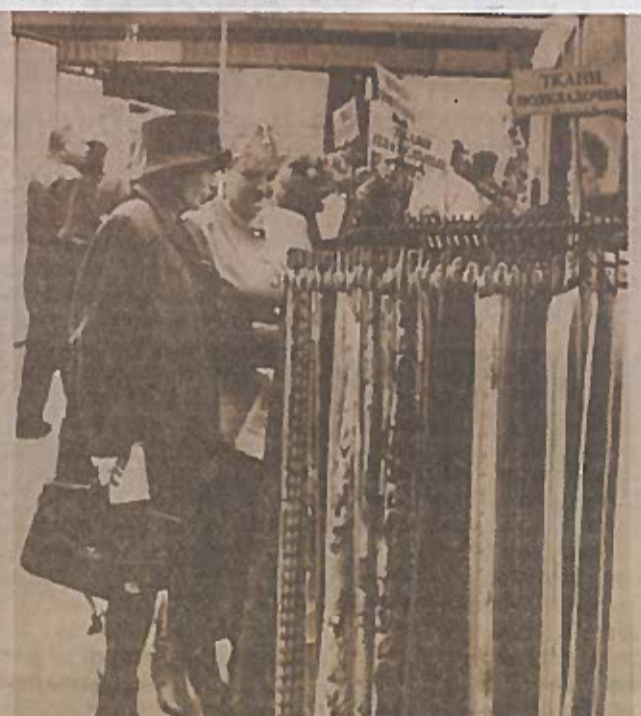
Во время выставки-ярмарки белорусских производителей, 2 октября 1997 года.

В этот же день «НГ» писала: «Вынікам сустрэчы двух прэзідэнтаў, якая працягвалася амаль гадзіну, стала іх сумесная заява. У ёй, у прыватнасці, канстатуецца, што ўтварэнне 2 красавіка 1996 года Супольнасці Беларусі і Расіі стала гістарычнай падзеяй, якая вывела на новы ўзровень працэс яднання двух брацкіх народаў і інтэграцыі дзяржаў». А 11 марта сообщала о финале того визита: «У аэрапорце Унунава Кіраўнік нашай дзяржавы адказаў на пытанні журналістаў. У перспектыве Аляксандр Лукашэнка бачыць Супольніцтва Беларусі і Расіі з найвышэйшым узроўнем інтэграцыі ў эканоміцы».