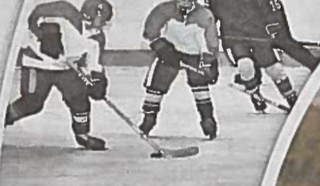
Турнир «Золотая шайба», март 1997 года.