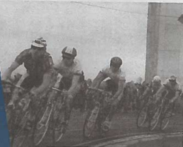
Спортивный праздник, посвященный 60-летию БГУФК, 1997 год.