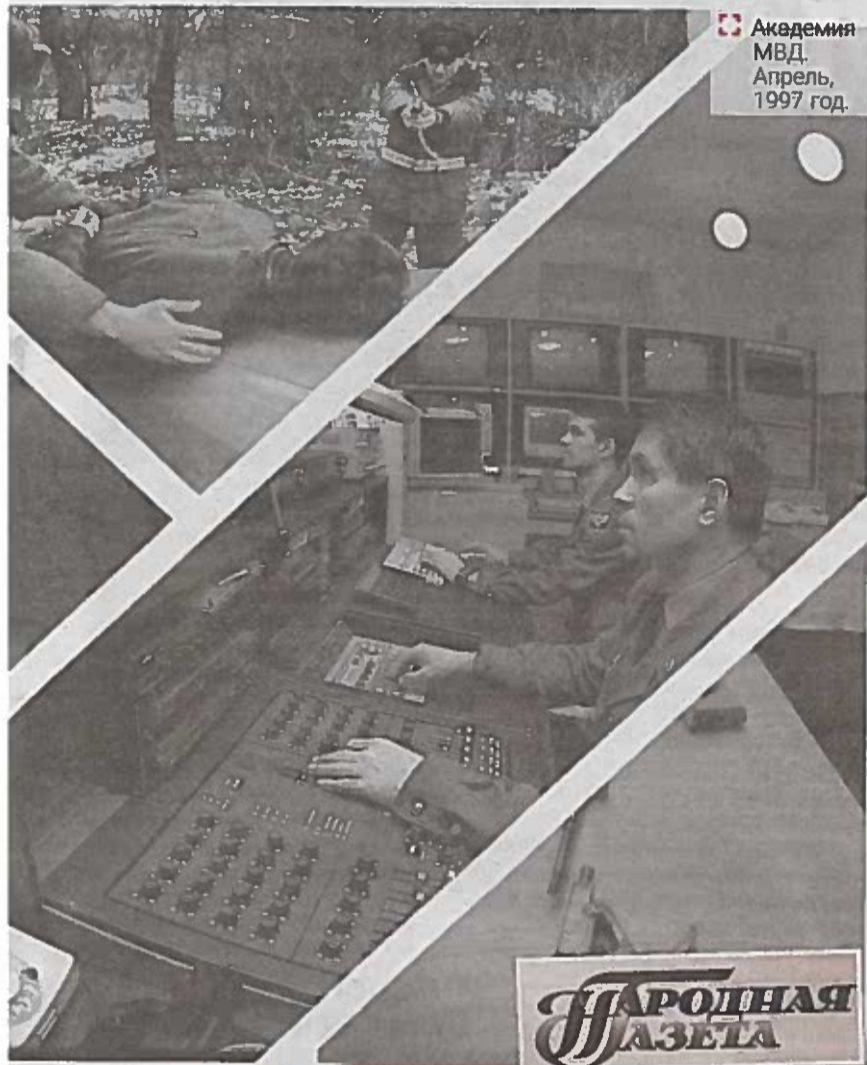
Академия МВД. Апрель, 1997 год.