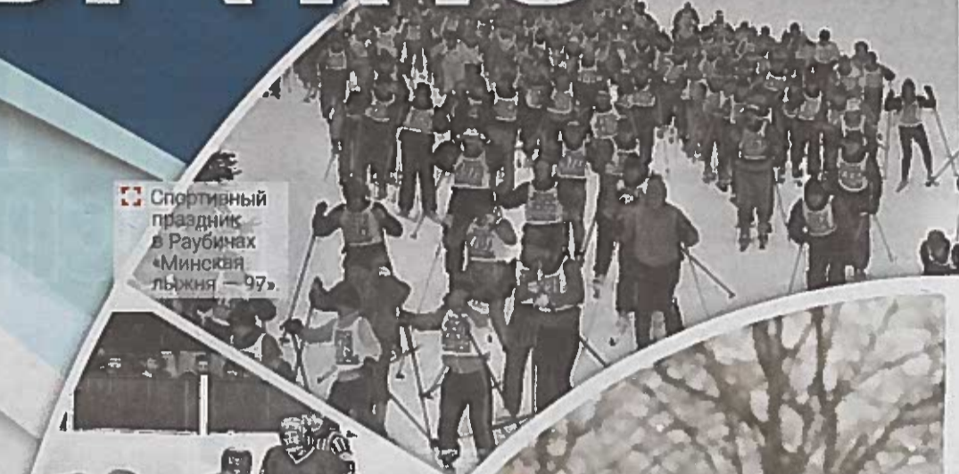
Спортивный праздник в Раубинах «Минская лыжня — 97»

— В нашей родной Беларуси царят мир, покой и согласие. Надо сказать, что главным нашим социальным и историческим достоянием, гарантом будущих успехов страны является единство белорусского народа... И до тех пор, пока нас укрепляет единство, мы непобедимы!