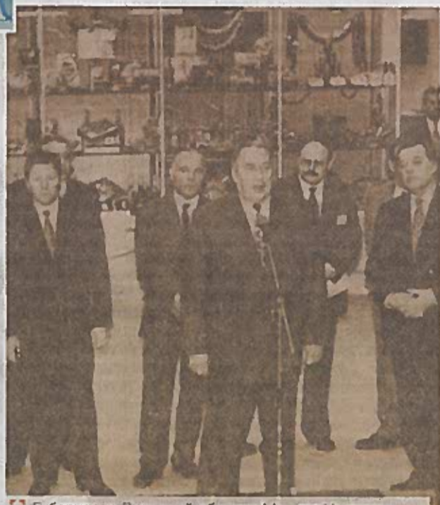
Губернатор Липецкой области Михаил Наролин на торжественном открытии Дней Беларуси в Липецке, 2 октября 1997 года.